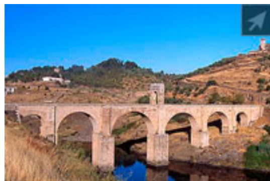
Ponte di Alcántara sul Tago - Spagna

Altra prerogativa delle strade romane era che queste dovevano essere vie terrene (in terra battuta) che a volte venivano coperte di ghiaia .