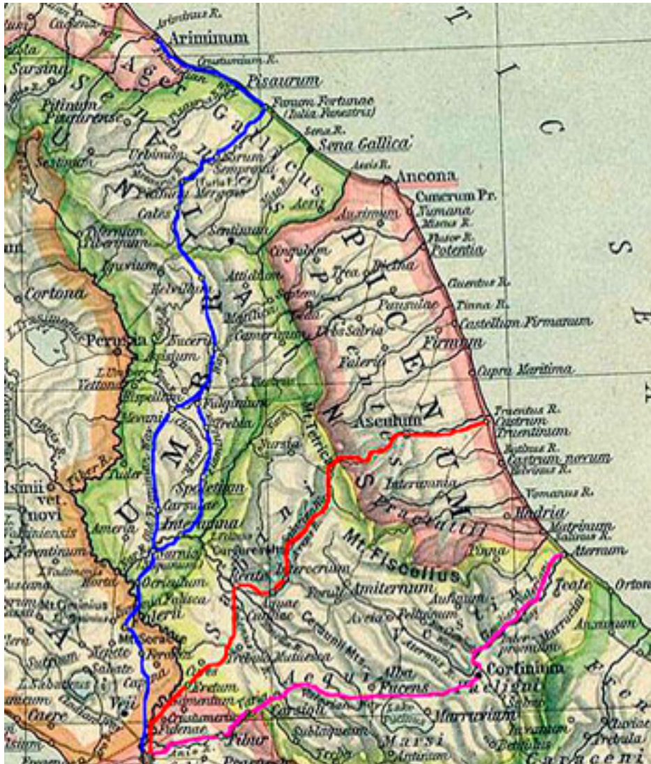
■ Via Salaria ■ Via Tiburtina ■ Via Flaminia