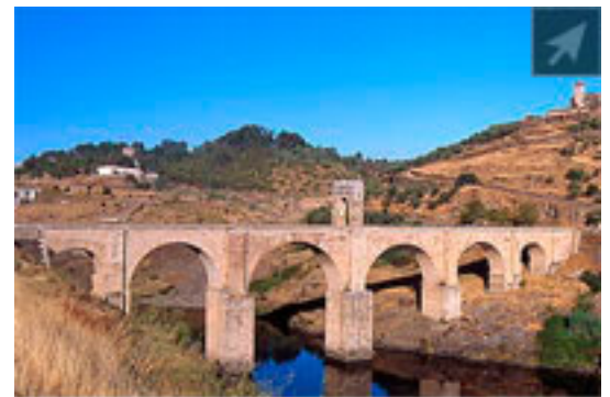
Ponte di Alcántara sul Tago - Spagna

Altra prerogativa delle strade romane era che queste dovevano esse re . Le vie più semplici erano vie terranea (in terra battuta) che a volta venivano coperte di ghiaia