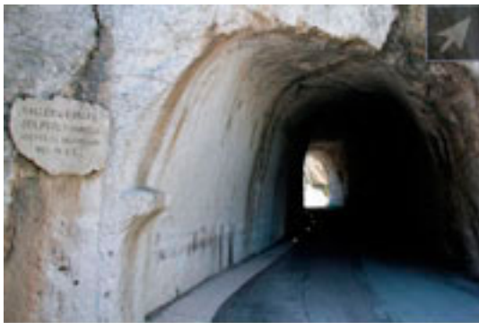
Galleria del Furlo - Fano

Allo scopo di realizzare strade il più brevi possibile, aggiavano gli impedimenti di fiumi e paludi a costo pari a Romani . I corsi d'acqua venivano superati con ponti in pietra realizzati con queste tecniche che non si costruiti che non si . Nei terreni paludosi si innalzava il livello della strada fino a due metri sopra la palude per mezzo di grandi massi . In prossimità di massi che ostruivano il cammino si ricorreva a gallerie scavate a mano (una di queste è la Galleria del Furlo ). Nei pressi di dirupi, terreni montuosi o collinari si ricorreva a grandi sbancamenti o tagli verticali netti de le . Nelle strette valli o nei passaggi montuosi, la strada veniva tenuta molto in quota in modo da scongiurare le